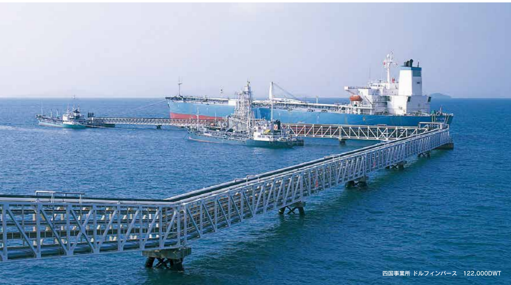
四国事業所 ドルフィンバース 122,000DWT

太陽石油はお客様のさまざまなニーズに応えるため、地球に優しい製品を安定供給しております。毎日の暮らしのためだけでなく、産業活動の中でも広く活用される石油製品を、安全・確実にお届けするため、生産設備の増強・合理化、流通施設の設備拡充に取り組み、安定供給に万全の態勢で取り組んでおります。