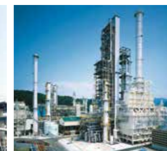
BTX設備 原料であるナフサに水素化処理や接触改質処理を行い、得られた改質油を蒸留、抽出、トランスアルキル化することで、ベンゼン・キシレンを製造します。