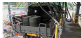
四国事業所 ドラム出荷設備 大規模災害時には陸上自衛隊と連携し、石油製品の供給支援を行います。