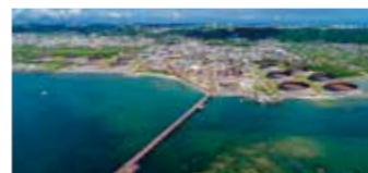
南西石油株式会社(沖縄県西原町) 同社のターミナルを経由し、沖縄県内に石油製品を供給しています。