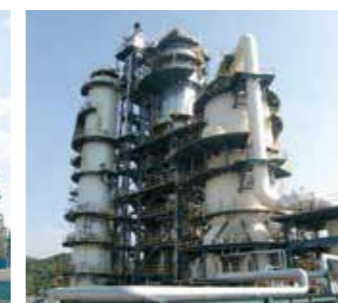
残油流動接触分解装置 原料である重油を高温低圧雰囲気中で触媒と接触させることで分解し、プロピレン・LPG・ガソリン留分を製造します。