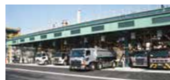
四国事業所 陸上出荷設備