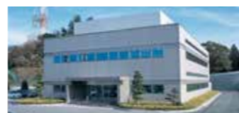
四国事業所 試験分析センター 製品の試験分析と品質管理、製品の品質向上、有害物質の除去、環境・エネルギー関連の技術研究・開発等を実施しています。