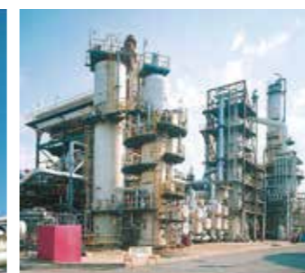
水素化分解装置 減圧蒸留装置で残渣油から分留された減圧軽油を、水素ガスと混合し、高温高圧雰囲気中で触媒と反応させ、高品質のナフサ・灯油・軽油を製造します。