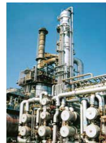
常圧蒸留装置 原油を蒸留し、LPG・ナフサ・灯油・軽油・残渣油の各留分に分離します。