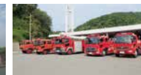
防災センターと化学消防車群