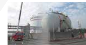
消火隊による泡放水消火活動

両事業所では、自衛防災組織を設置しています。定期的に防災訓練を行うことで、自衛防災隊の迅速な防災体制の確立と、防災活動の習熟を図っています。